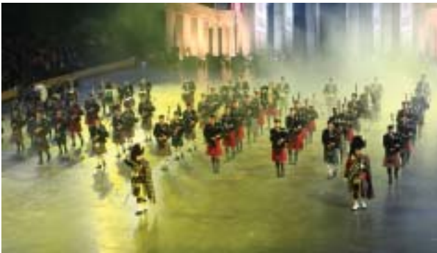
Massed Pipes and Drums