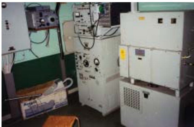
Radarrummet, teknikernas arbetsplats