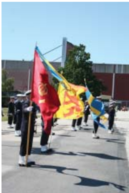
Fanor från Karlskrona kustartilleriregemente, KA 2 och Kronobergs regemente, I 11 (traditionsfanor) samt Marinbasens flagga