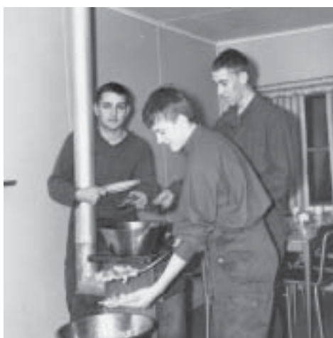
Dags för mat