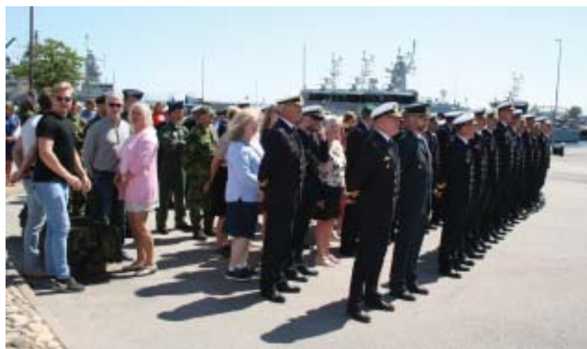
Marinbasens personal uppställda för chefsbyte