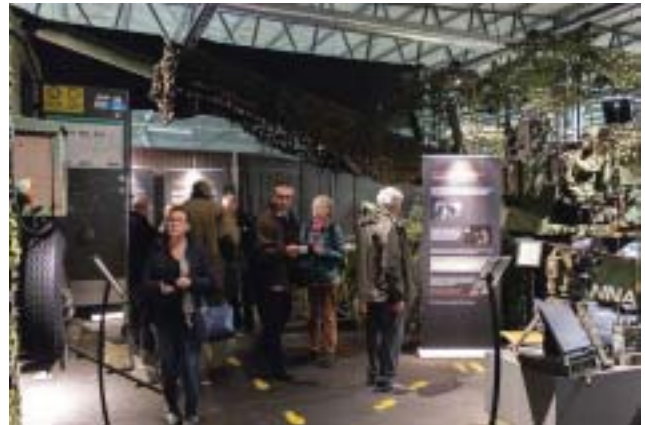
Besök i utställningen Strid mot landstigning