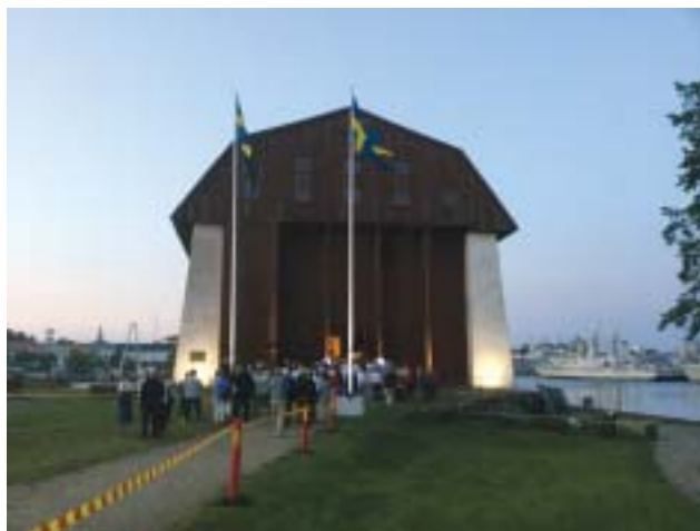
Publik utanför Vasaskjul