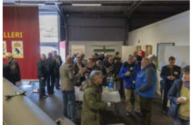
SMHA-konferensen besöker museet. Besöket startar med en kopp fika efter färden från staun