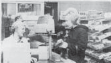
Inte mer? Många handlar på Provianten för de låga priserna skuld.

Det handlar om den sista kvarvarande proviantboden i Sverige, Mariens Proviantbod i Karlskrona. Nästan inkänd under den väldiga kasernen på Sparre ligger den nere vid bron över Stambultskanalen. Där har Provianten haft sina lokaler sedan 1930, då man flyttade ur källaren på Sjöofficerskåsen, till ständigt glädje för kunderna, och avsevärt för många andra.