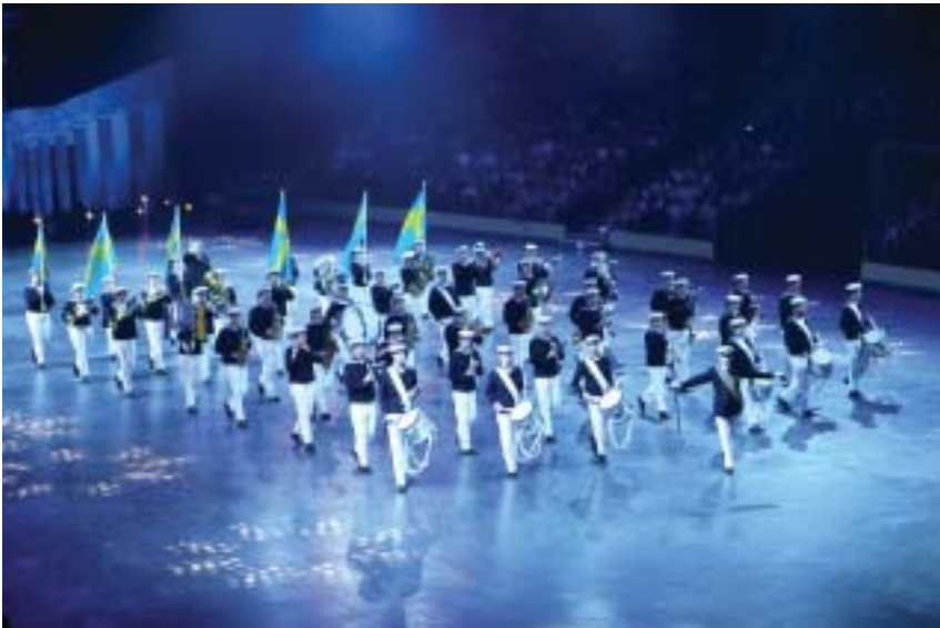
Marinens Ungdomsmusikkår Kronan