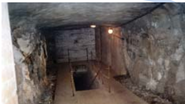
Ingång till radarstationen