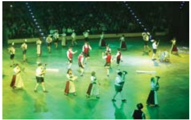
Blasmusikkapelle Bad Bayersoien från Bayern