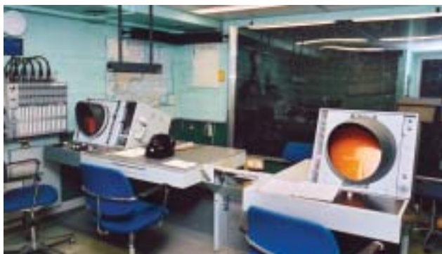
Operationsrummet. PPI för sjölägesrapportering