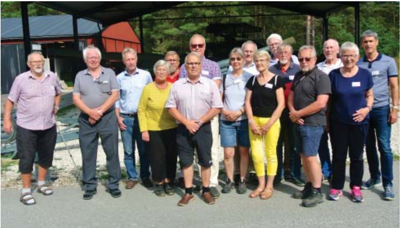
KA 2 kamraterna samlade inför avresan mot hembygden.

genuint fiskeläge. På återresan mot lägret fick vi initierad och intressant information om Fårös flora, fauna och geologiska förhållanden.