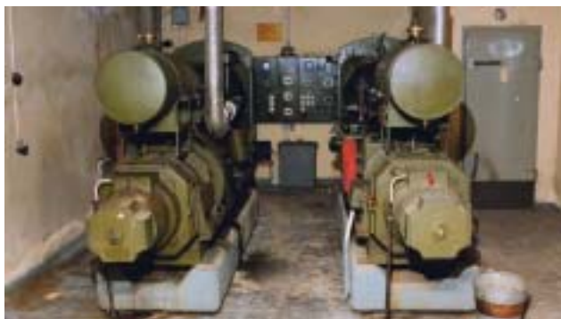
Två kraftaggregat för strömförsörjning