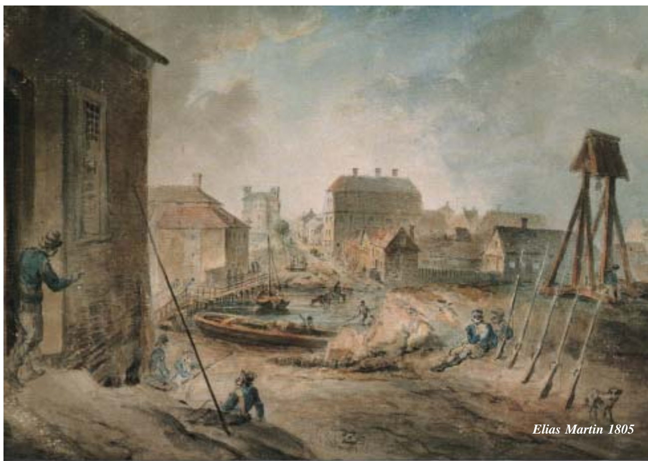
Elias Martin 1805