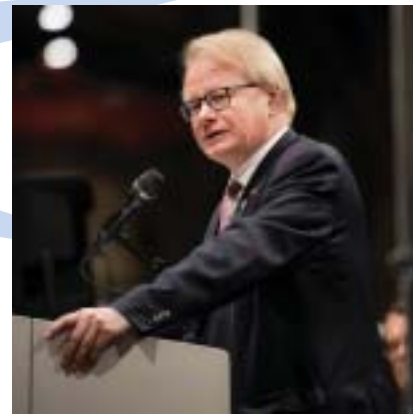
Försvarsminister Peter Hultqvist

skydd, som är helt unikt, i alla fall när vi nått den permanenta grupperingen inne i berget. För Muskö ÄR helt unikt i sitt slag, vilket leder till dagens andra perspektiv.