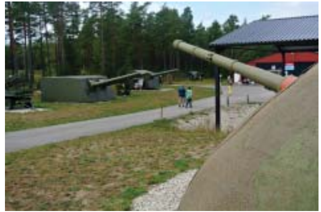
Sveriges största samling av fasta pjäser finns vid Gotlands försvarsmuseum