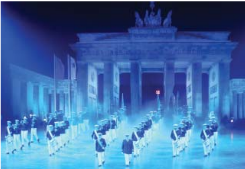
Marinens Ungdomsmusikkår Kronan