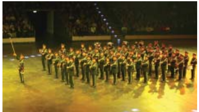
Polizeimusik Oberösterreich från Österrike

Som sista egna inslag kom ytterligare ett tyskt bidrag, nämligen "Fascinating Drums". Här kan vi tala om trumvirtuoser som genomförde ett enastående program, trumkost på högsta nivå. Publiken var minst sagt hänförd över skickligheten hos dessa "trummisar".