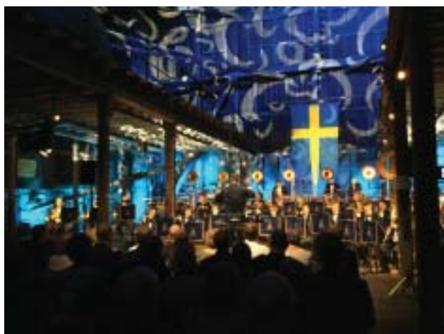
Konserten framfördes i ett vackert dekorerat Vasaskjul