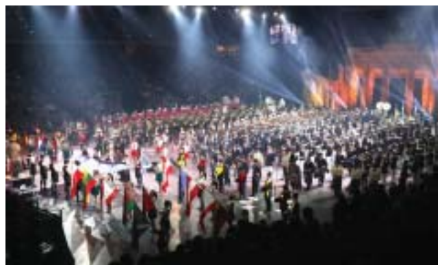
Den storslagna finalen med samtliga deltagare på scen