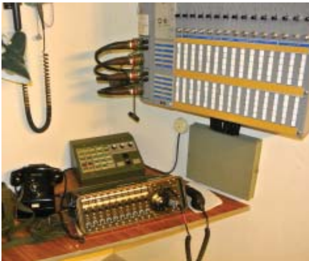
"Utan samband – Inga segrar". Inte bara kanoner visas upp, utan även ledningsutrustning!