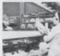
Den manliga kött-föraren är en av Proviantens stora ägggläddare.