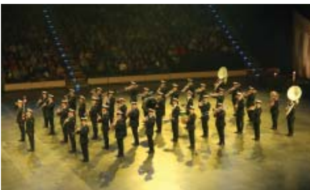
Warszawapolisens representationsorkester från Polen